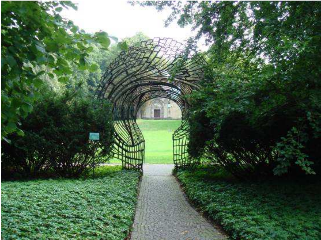
Urnenhain Ohlsdorfer Friedhof, Hamburg

In jüngster Zeit nehmen die Urnenbeisetzungen und die anonymen Bestattungen zu. Damit die Angehörigen auch hier einen Ort des Gedenkens haben, hat man z.B. in Hamburg auf dem Ohlsdorfer Friedhof, dem wohl weltgrößten Parkfriedhof, separate Urnenhaine mit eigenen Kapellen geschaffen.