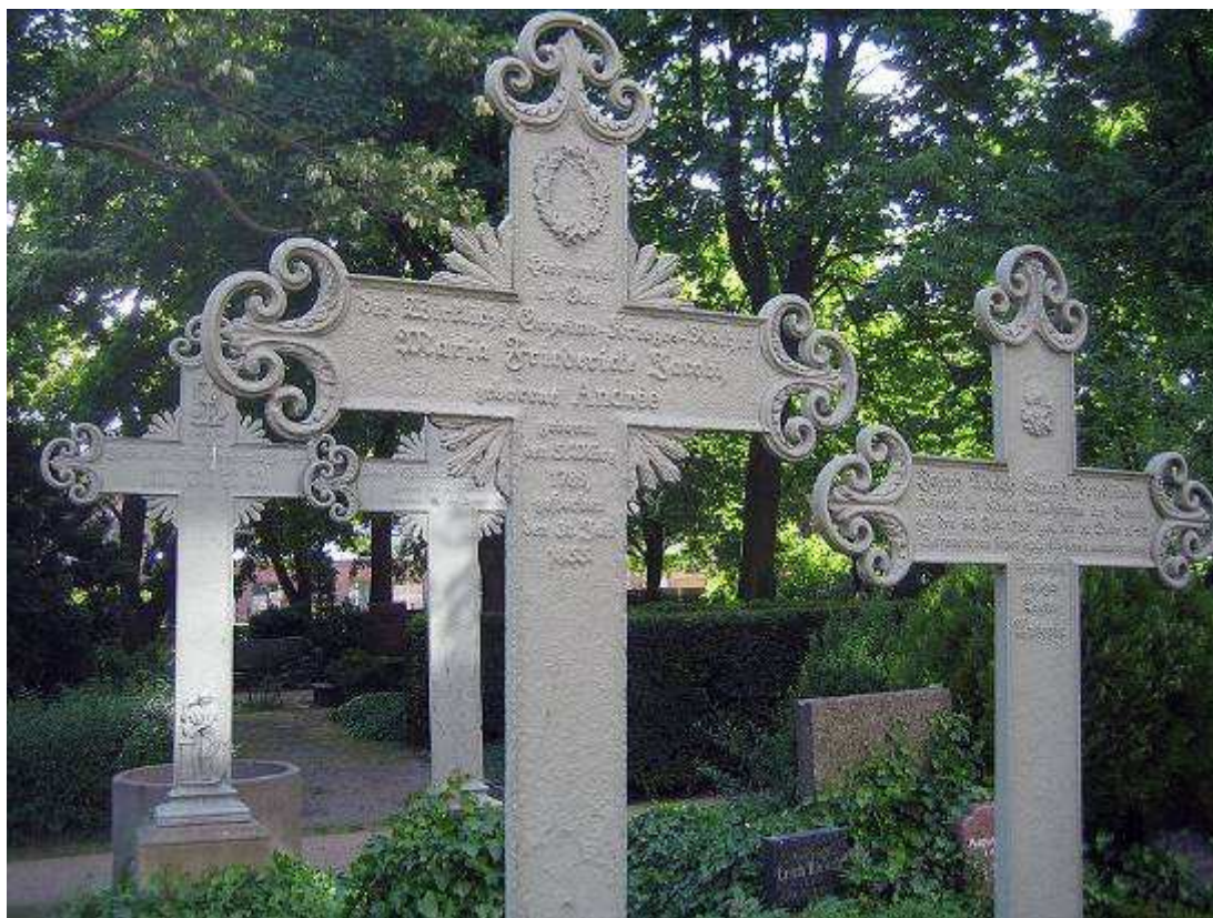
Städtischer Dorotheen-Friedhof in Berlin

Es ist ein guter Brauch, an diesem Tage die Friedhöfe zu besuchen und die Gräber zu schmücken, denn die Grabstätte ist der Ort des persönlichen Gedenkens. Vor allem auf alten Friedhöfen legen Grabdenkmäler ein Zeugnis von der tiefen Verbundenheit zu den Verstorbenen ab.